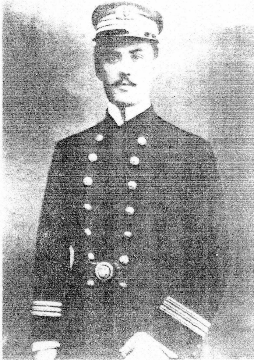
El Ingeniero Electricista Subinspector (Capitán de Fragata) de la Armada Argentina, Jorge NEWBERY, virtual fundador de la actividad aérea en la República Argentina. (Foto de su legajo personal, circa 1899, del D.E.H.N.).